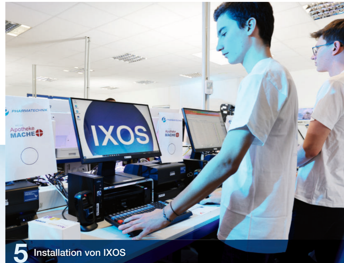
5 Installation von IXOS