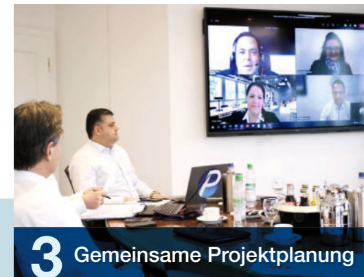
3 Gemeinsame Projektplanung

Schulungen in IXOS.campus lassen sich dank der IXOS-App ganz bequem auch auf dem Smartphone durchführen. Zum Beispiel der E-Rezept-Führerschein.