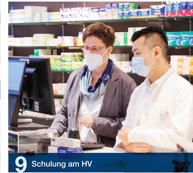
9 Schulung am HV