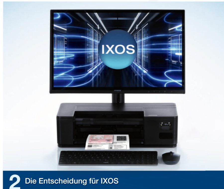
2 Die Entscheidung für IXOS