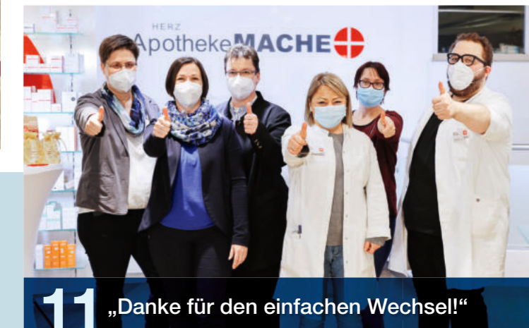
11 „Danke für den einfachen Wechsel!“

Hier geht's zum Film über die Systemumstellung →