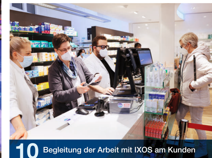
10 Begleitung der Arbeit mit IXOS am Kunden