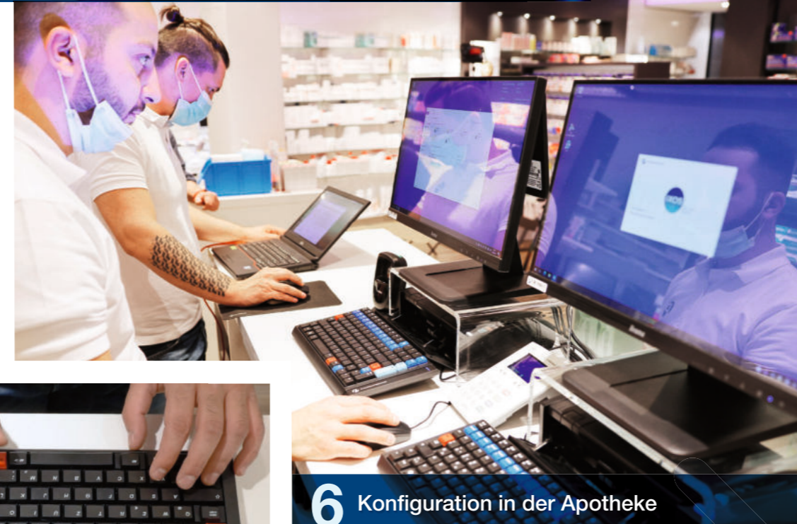
6 Konfiguration in der Apotheke