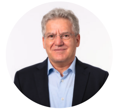
Stephan Mache Apotheken | GRUPPE MACHE

„Es war die richtige Entscheidung! Die neuen, digitalisierbaren Prozesse entlasten spürbar die Mitarbeiter.“