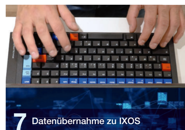
7 Datenübernahme zu IXOS