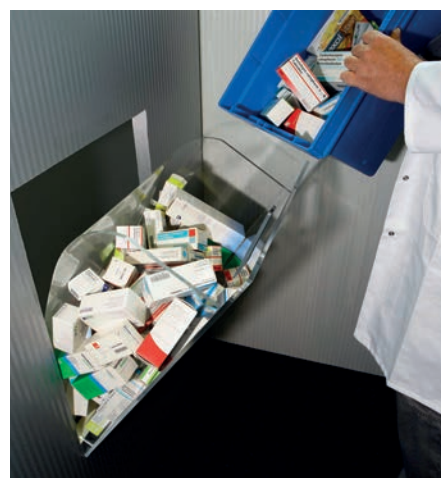
Befüllung der Medikamente